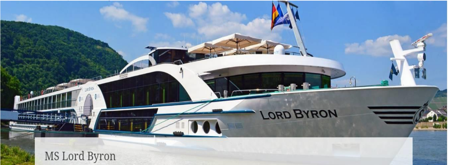
MS Lord Byron

2012 yılında seferlerine başlayan geminin uzunluğu 110m, genişliği 11,40m, yüksekliği 6 metre ve toplam 3 katlı olan gemide 74 kabin bulunmaktadır ve yolcu kapasitesi 148 olarak belirlenmiştir. Dış ve French Balkonlu kabinler 15 m2 , Mini Suit kabinler 19 m2 , Suit kabinler ise 22 m2 büyüklüğündedir. Tüm kabinlerde; klima, Tv, telefon, minibar, kasa, saç kurutma makinası, kıyafet askısı, havlu, şampuan gibi imkanlar mevcuttur. (Suite kabinler haricindeki kabinlerde Terlik ve Bornoz bulunmamaktadır).